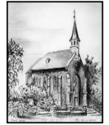
Kath. Pfarrgemeinde St. Mariä Empfängnis Stolberg-Dorff